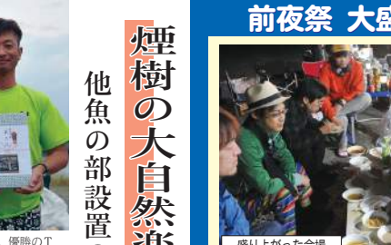
盛り上がった会場

今年、他魚の部は前年同様、大会の開催が困難に。それぞれが思い思いのポイントで釣るという方式を取ったが、釣果は芳しくなかった。大会自体は「おもしろかった」という声が上がったものの、釣果に恵まれない「釣り大会」というのに不満の声も上がったのは事実。このページではそう返る問題点なども含め、大会の全容を振り返る。